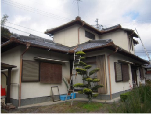
築30年 在来木造の家